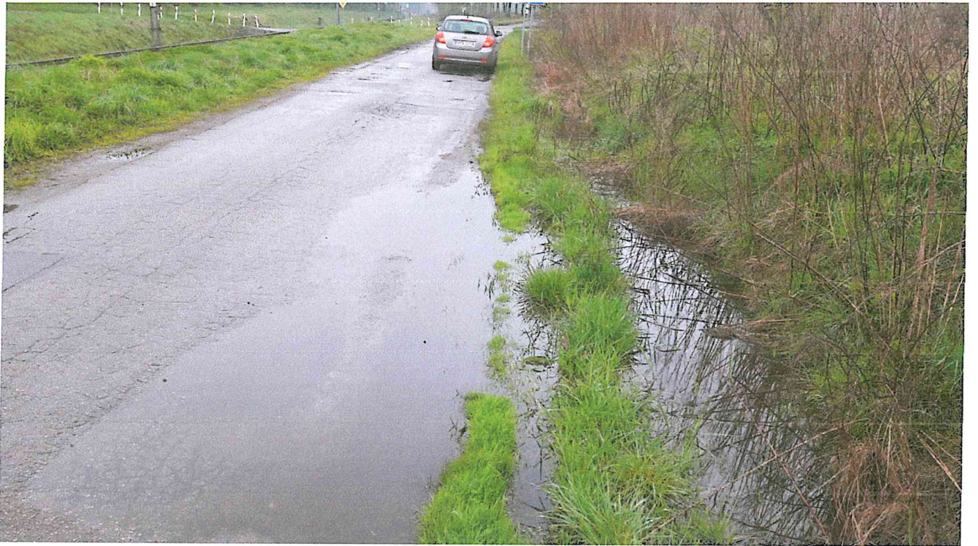
Ulica Myśliwska - listopad 2017