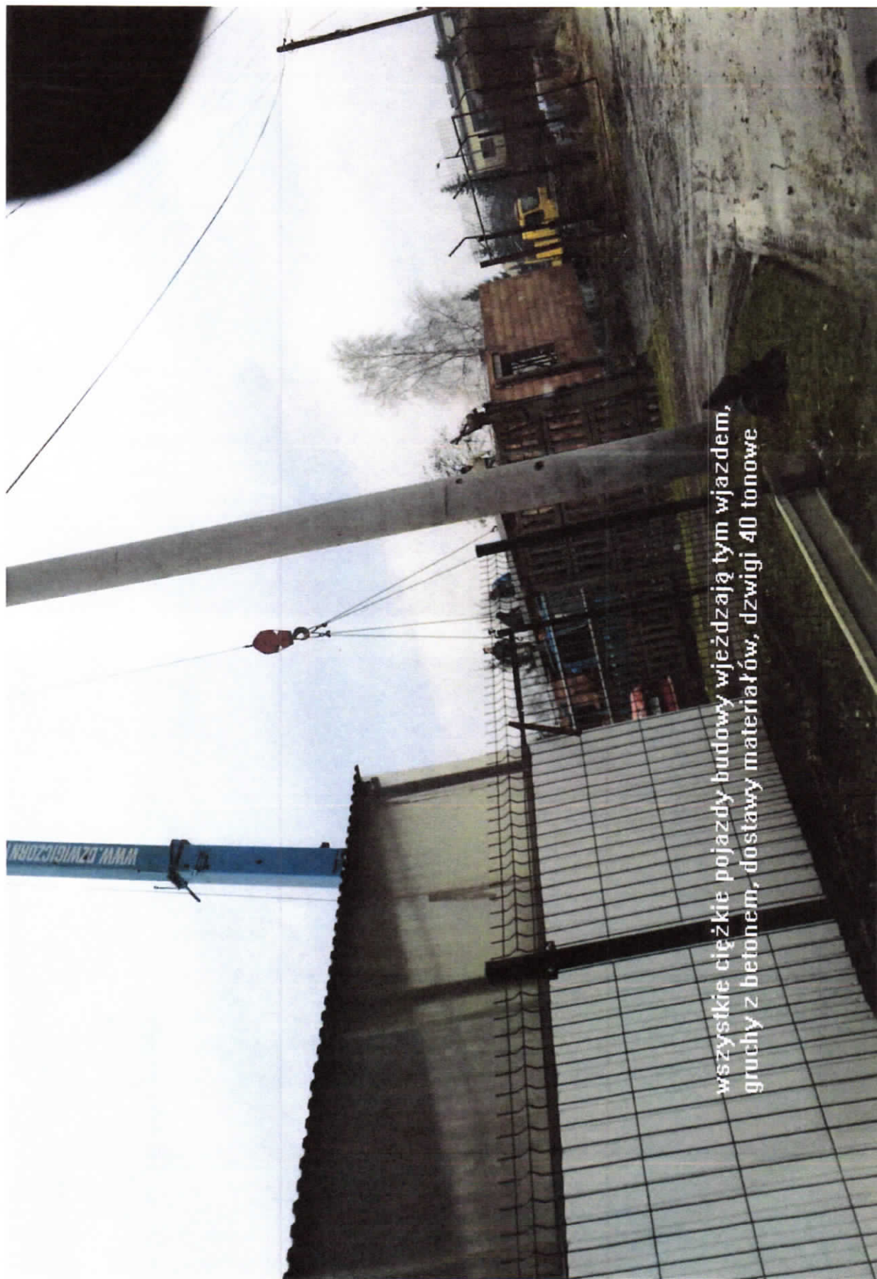
wszystkie ciężkie pojazdy budowy wjeżdżają tym wjazdem, gruchy z betonem, dostawy materiałów, dźwigi 40 tonowe