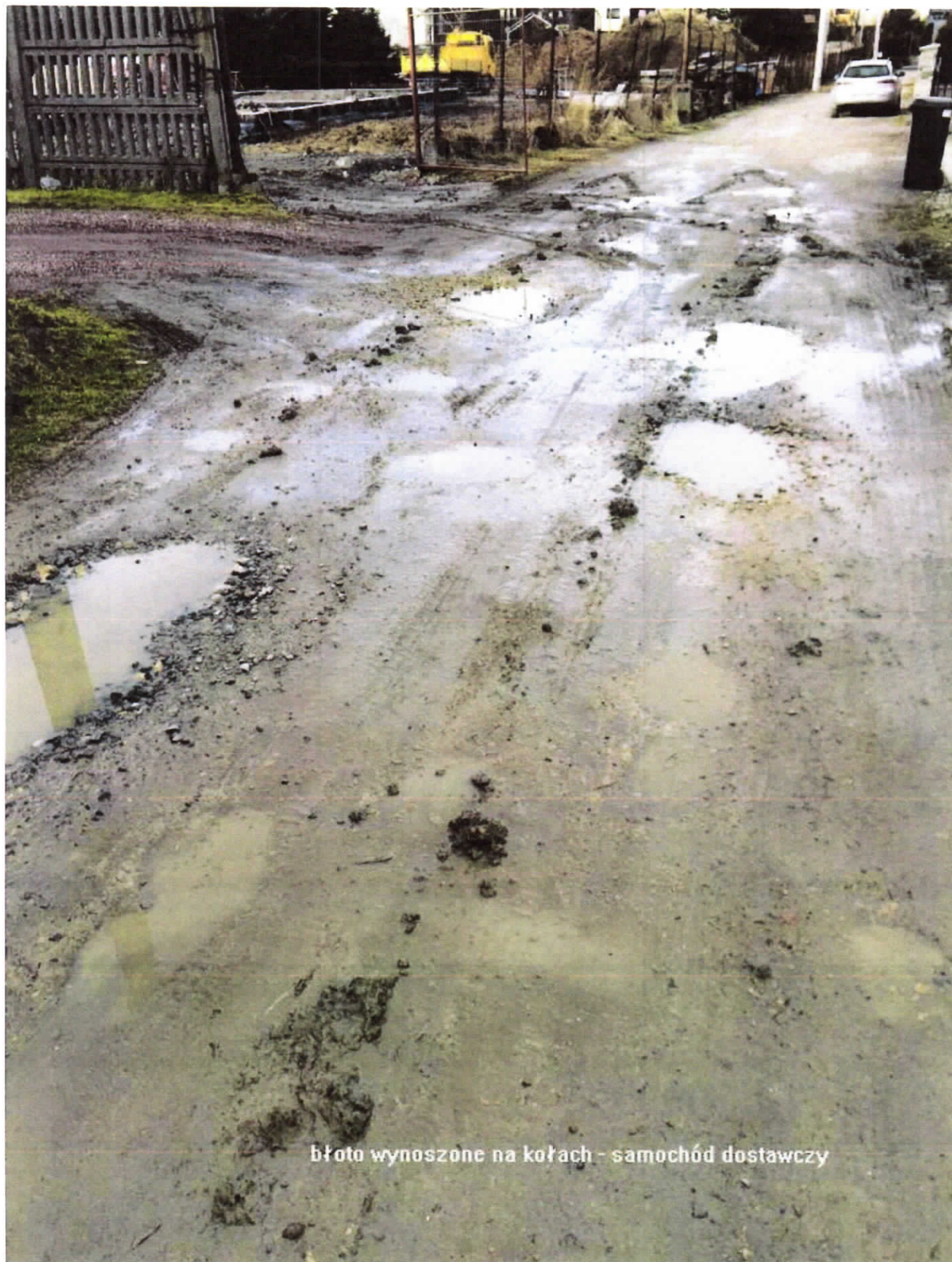
błoto wynoszone na kołach - samochód dostawczy