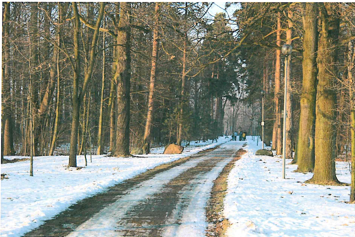
Odcinek 160 m - brak oświetlenia ulicznego